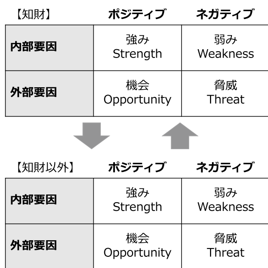
図5 クロスSWOT分析の情報収集・分析プロセス